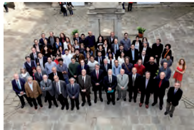
FOTOGRAFIA 20. Els premiats en la convocatòria, al pati de la Casa de Convalescència de la seu de l'IEC.