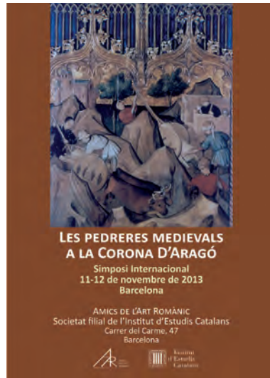
FOTOGRAFIA 7. Anunci del simposi.