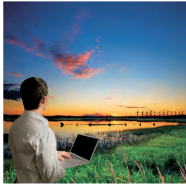
FOTOGRAFIA 17. Cartell anunciador de la jornada.