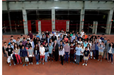
FOTOGRAFIA 21. Els guanyadors de la XIX Prova Cangur.