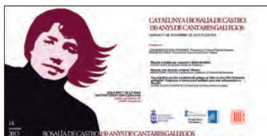
FOTOGRAFIA 8. Invitació a l'acte de commemoració.