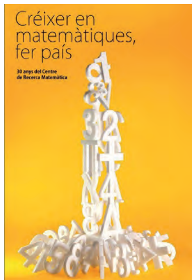
FOTOGRAFIA 22. Cartell anunciador de la commemoració.